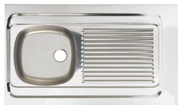
SCHÉMA TECHNIQUE :