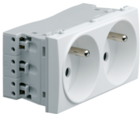
Systo Prise double 2P+T spéc. goulotte