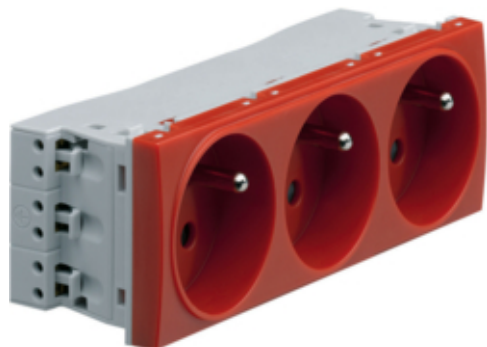
Systo Prise triple 2P+T détromp goulotte