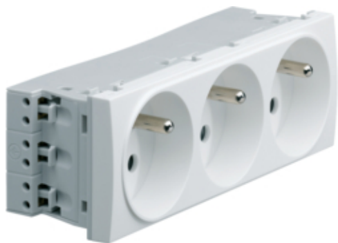
Systo Prise triple 2P+T spéc. goulotte