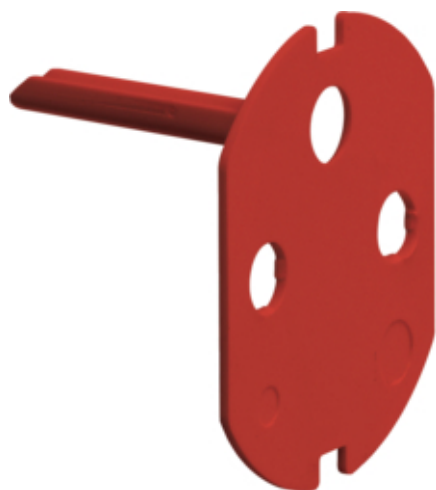
Systo-Kallysta Détrompeur prise