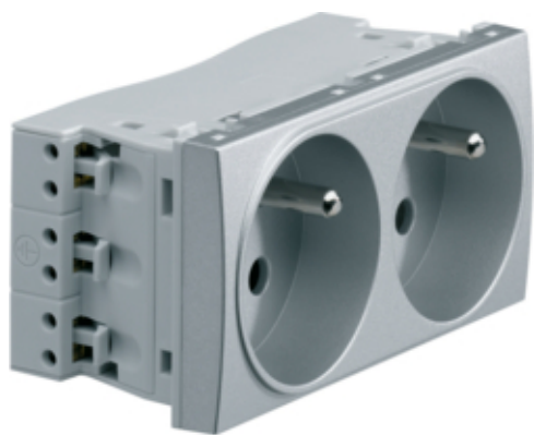
Systo Prise double 2P+T Titane