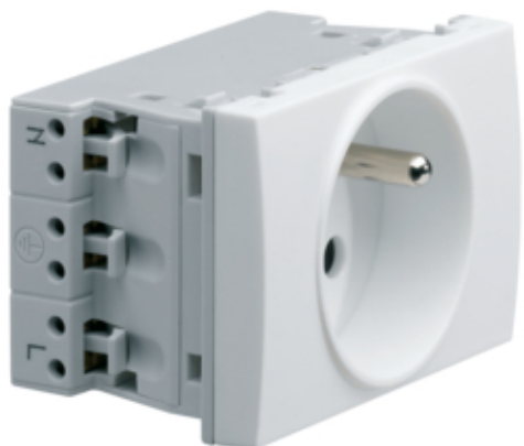
Systo Prise 2P+T spéc. goulotte